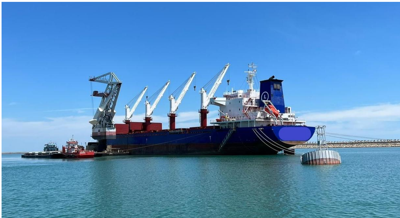
Terminalul TTS1: Încărcare cereale, iulie 2022

În condițiile în care portul Constanța nu dispune de suficiente spații de depozitare pentru a opera fluxurile masive de cereale ucrainene apărute pe piață, terminalul de geamanduri a fost soluția găsită de TTS pentru a avea acces la transportul și operarea acestor fluxuri.