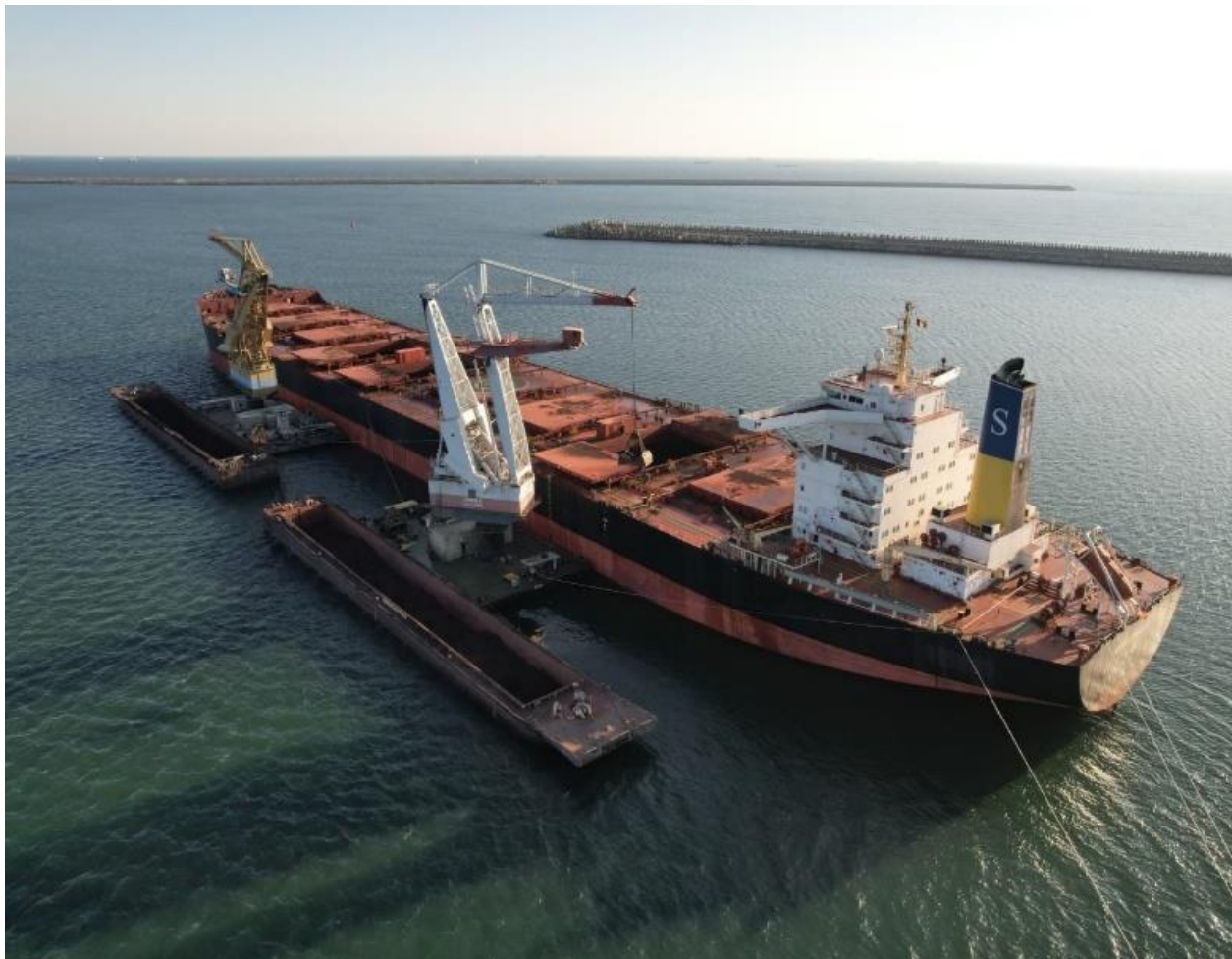
Terminalul TTS2: Încărcare minereu în navă clasa "Capesize", octombrie 2022

Terminalul de geamanduri TTS2 fost deschis în luna septembrie, având ca obiectiv preluarea de noi fluxuri începând cu trimestrul al patrulea, în paralel cu fluxurile de cereale ce vor fi derulate în continuare prin lanțul logistic ce are TTS1 ca punct terminus.